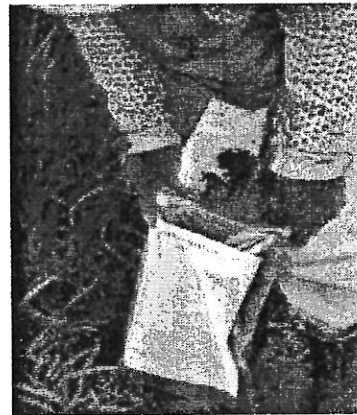
圖 4.土壤採樣示意圖